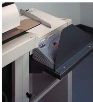
Recepção de livros