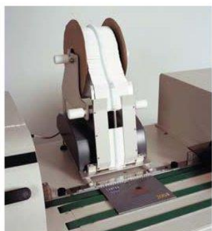
Alimentador de aaa (opcional)